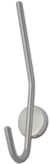
TT07H2 Percha Doble