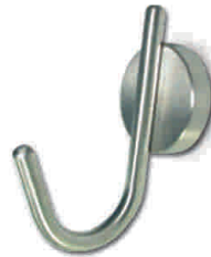
TT07H1 Percha Simple