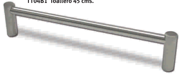
TT04B1 Toallero 45 cms.