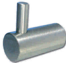
TT03H3 Percha Simple