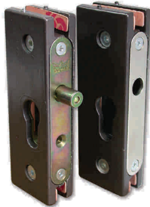
SM 51 E