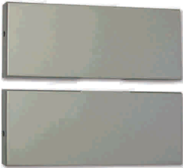
Tapa para SM-1020A plata