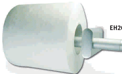
EH2004 Porta Rollo

Marca: DAP Acabado: Aluminio Código 053103000700 • Descripción Porta Rollo Aluminio