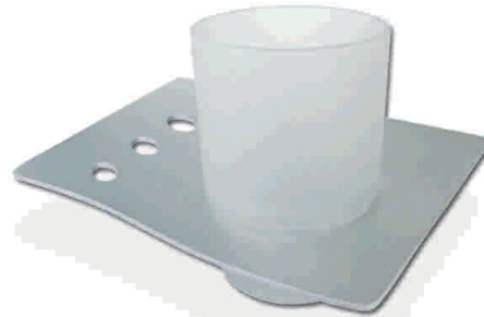
EH2002 Porta Vaso

Marca: DAP Acabado: Aluminio Código 053104000600 • Descripción Porta Vaso Aluminio